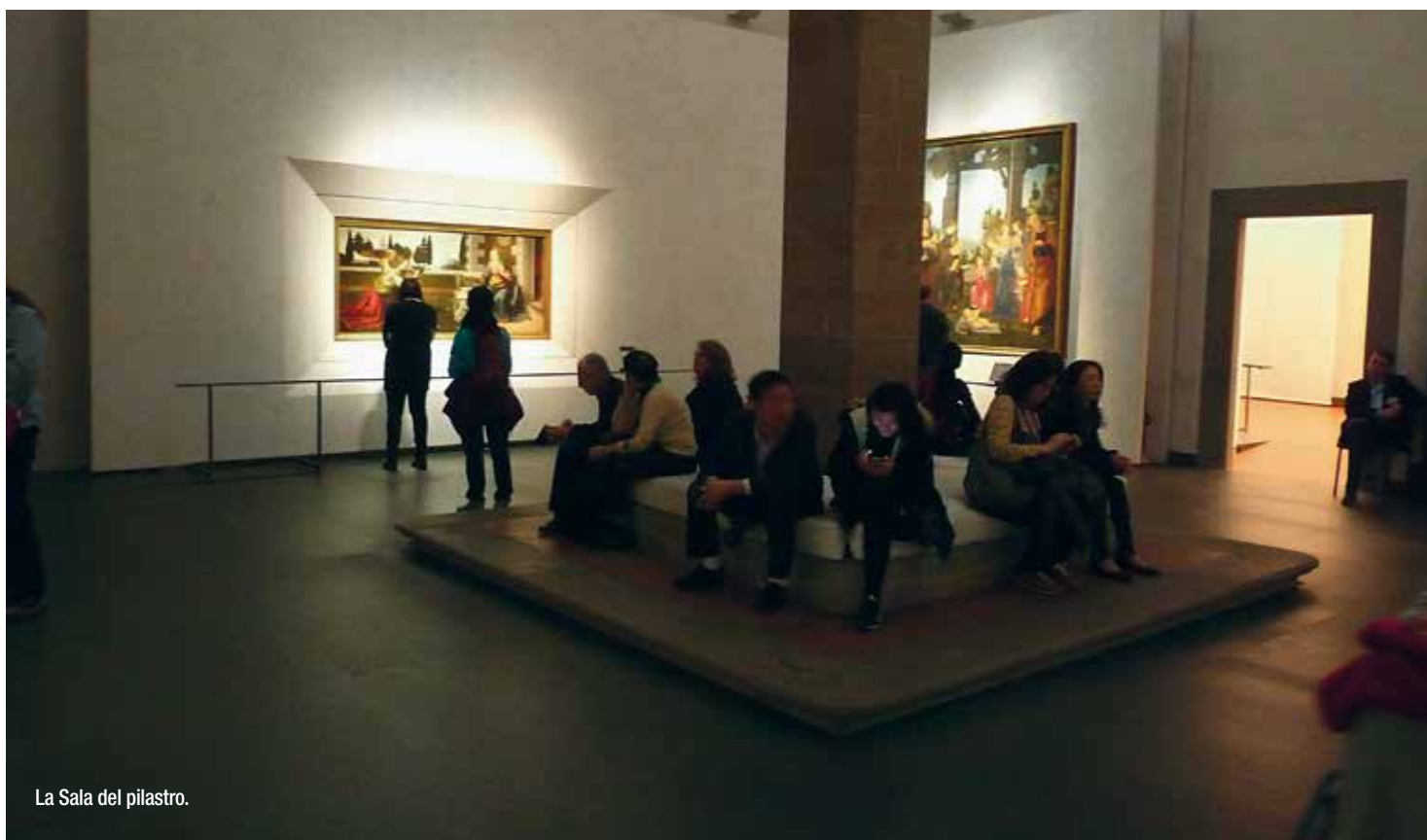
La Sala del pilastro.

nella sala 22. Per Leonardo, dopo varie ipotesi, si è optato per allestirne le opere, insieme a quelle di altri maestri attivi nella bottega del Verrocchio, al primo piano, nella cosiddetta Sala del pilastro, uno degli ambienti più ampi e suggestivi delle nuove stanze della Galleria; la realizzazione del progetto è stata possibile grazie al contributo degli Amici degli Uffizi. Per l'occasione sono state create apposite vetrine climatizzate con illuminazione interna che garantiscono un'ottima visione delle opere. Dall'allestimento della sala è ovviamente esclusa l'Adorazione dei Magi di Leonardo, ancora in restauro presso l'Opificio delle Pietre Dure. (D.P.)