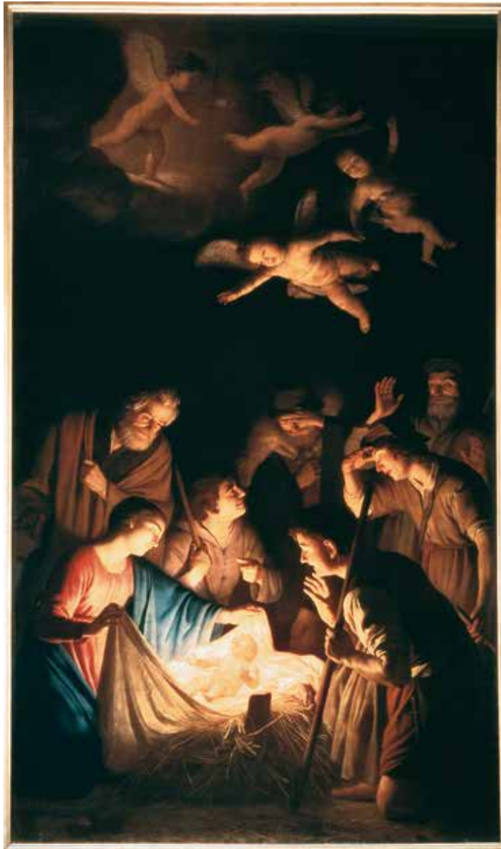
Gherardo delle Notti, Adorazione dei pastori (prima dell'attentato del 1993), Galleria degli Uffizi.